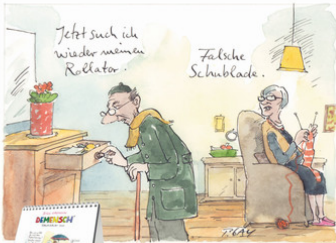
Dieser Cartoon stammt aus dem Kalender DEMENSCH. Postkartenkalender 2020 von Thomas Klie und Peter Gaymann, medhochzwei Verlag